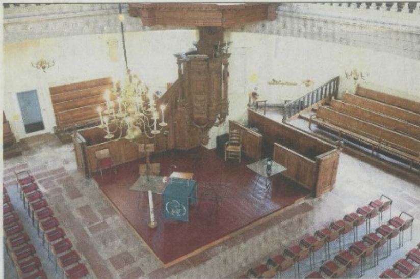
Vanaf de galerij heb je een prachtig zicht op het interieur.