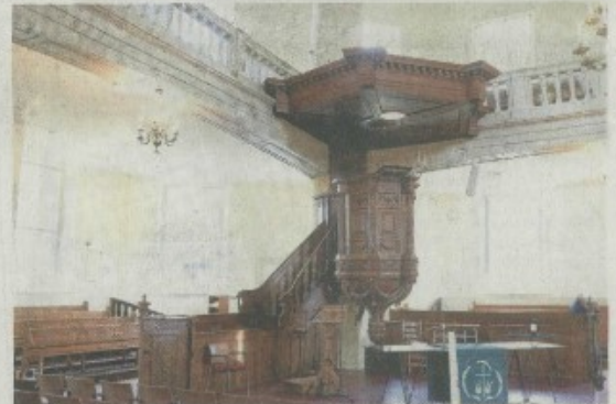
De preekstoel is een van de hoogste van Nederland.