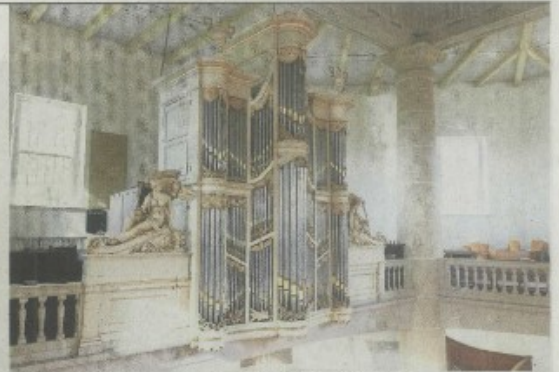
Het Van Oeckelen-orgel dateert uit 1840 en is in 2017 gerestaureerd.

Van den Bosch noemt zijn gemeente pluriform. „Een deel is vrijzinnig, een deel orthodox en een deel evangelisch. We zijn een dorpskerk en we hebben elkaar nodig.”